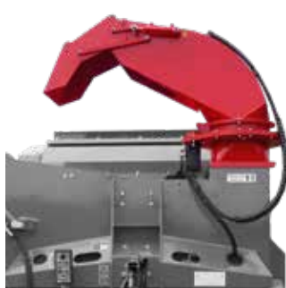
Goulotte orientable à 300°