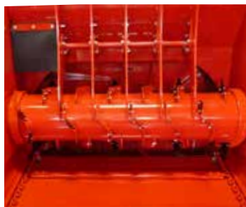
Simple Démêleur Ø500 à doigts fixes Tous fourrages (entraînement mécanique)