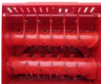
Double démêleurs Ø620+Ø460 à doigts fixes Brins courts, tous fourrages (entraînement mécanique)