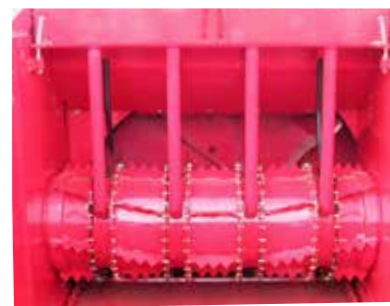
Simple démêleur Ø640 à doigts mobiles Brins longs, enrubannage (entraînement mécanique)