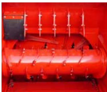
Simple démêleur Ø500 à spires et sections Ensilage et paille (entraînement hydraulique)

Simple, double ou triple démêleurs, une multitude de solution pour satisfaire vos besoins !