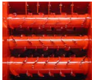
Triple démêleurs Ø620+Ø460+Ø460 à doigts fixes. Tous fourrages (entraînement mécanique)