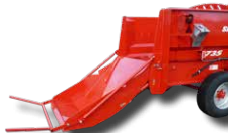
Système tubulaire uniquement disponible sur la RD735

La conception unique de la porte garantit la sécurité de l'utilisateur lors du chargement des bottes.